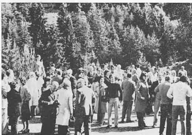
Un gruppo di alpinisti dinanzi alla Chiesa del Centro Turistico

Ultimata l'assemblea e consumata la cena nel grande ristorante dell'albergo, i soci hanno assistito alla proiezione di alcu-