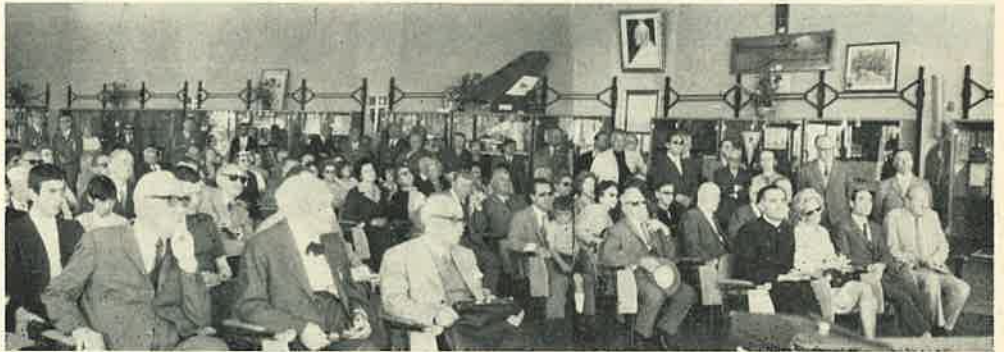
La grande riunione nel Sacratio degli Sports Nautici

Amici carissimi dell'Eneo, sorride sempre e specie in questa grande ricorrenza al nostro animo — dopo la lenta e difficile ripresa — una visione bella, come quella che ci offre questo meraviglioso lago della nobile Como