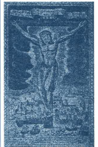
Questa vecchia incisione differisce da quella del 1896 per le scritte in tedesco

Coll'andar poi dei secoli fu grande la devozione alla miracolosa effigie. E ben a ragione. Quasi di continuo i Fiumani risentirono i favori di questa Santa Croce; più volte furono allontanati i pericoli, fugate le malattie e superate calamità private e pubbliche. - Alla metà circa del secolo XV p. e. i pirati Veneti, infestissimi alle vicine isole, armarono moltissime navi, coll'intenzione di devastare Fiume. I cittadini ricorsero alla S. Croce, ed i pirati si ritirarono, non avendo arrecato danni di conto. Nell'anno 1599 essendo afflitte queste regioni da gravissima pestilenza, inferendo sempre più il morbo, apparve nell'aria tra il monte Calvario e il monte di Tersatto il segno della croce di color bianco, la quale spiccata dal monte di Tersatto, con soave moto si avviò verso la città di Fiume, ove si fermò circa mezz'ora, da tutta la gente molto ben voluta ed osservata e che svanendo dagli occhi loro, li lasciò attoniti e stupefatti quasi fuor di sé stessi per il miracolo veduto, implorando misericordia a Dio ed alla vergine. I Fiumani allora istituirono feste