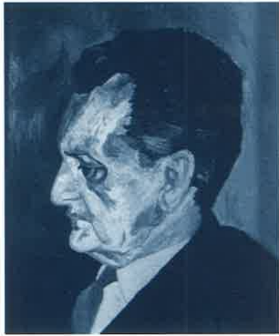
Roberto Marvulli, Ritratto di Diego de Castro, olio su tela, 1972

E in particolare, ancora secondo il Parlato: Si sostenne che "comunisti e democristiani, portatori di ideologie internazionalistiche o di un pensiero sociale ecumenico" erano stati "poco sensibili al dato nazionale", (...) specificamente per quel che mi riguardava "la frontiera orientale". Si dovrebbe pensare, però, solo per fare un significativo esempio, "alle raccomandazioni del giornale del Partito d'Azione (tra l'altro, un partito di stretta derivazione risorgimentale) affinché nel 1945 della Venezia Giulia si parlasse il meno possibile per non dare spazio a nazionalisti e a reazionari" (cfr. "E.