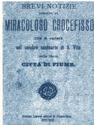
Copertina del libro