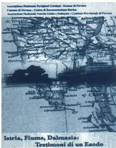
Istria, Fiume, Dalmazia: Testimoni di un Esodo Copertina del libro