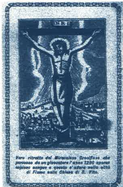
Vero ritratto del Miracoloso Crocefisso che processa da un giocatore l'anno 1296 sparato capioso sangue a questo altare nella città di Fiume nella Chiesa di S. Vito.

piedi del Crocefisso riuniva Fedeli de lingua croata anche de Sussak, come d'altronde per noi ai piedi della Madonna de Tersatto.