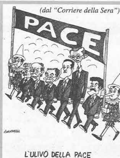
L'ULIVO DELLA PACE