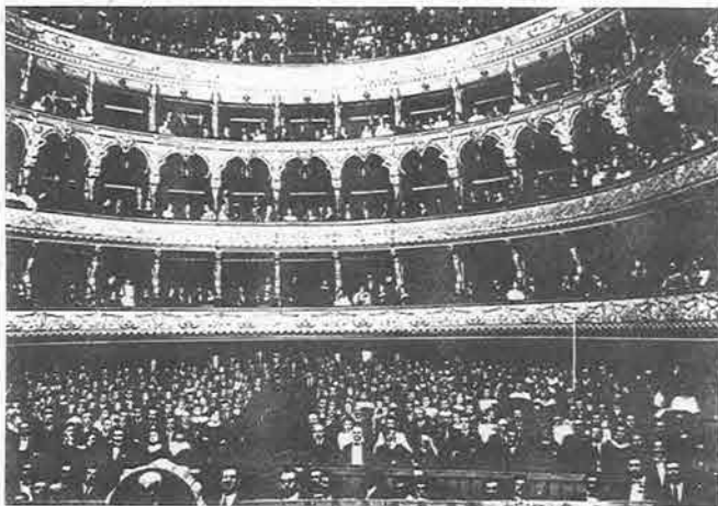
Una rara fotografia del Teatro Verdi scattata all'interno in occasione della rappresentazione dell' "Aida" nei giorni dell'annessione di Fiume all'Italia (16 marzo 1924).

Nei programmi teatrali di Fiume il nome del grande maestro Giuseppe Verdi appare la prima volta nel 1845 con il Nabucodonosor e si ripeterà poi quasi annualmente: nel 1846 con l' "Ernani", nel 1847 coi "Lombardi", nel 1848 coi