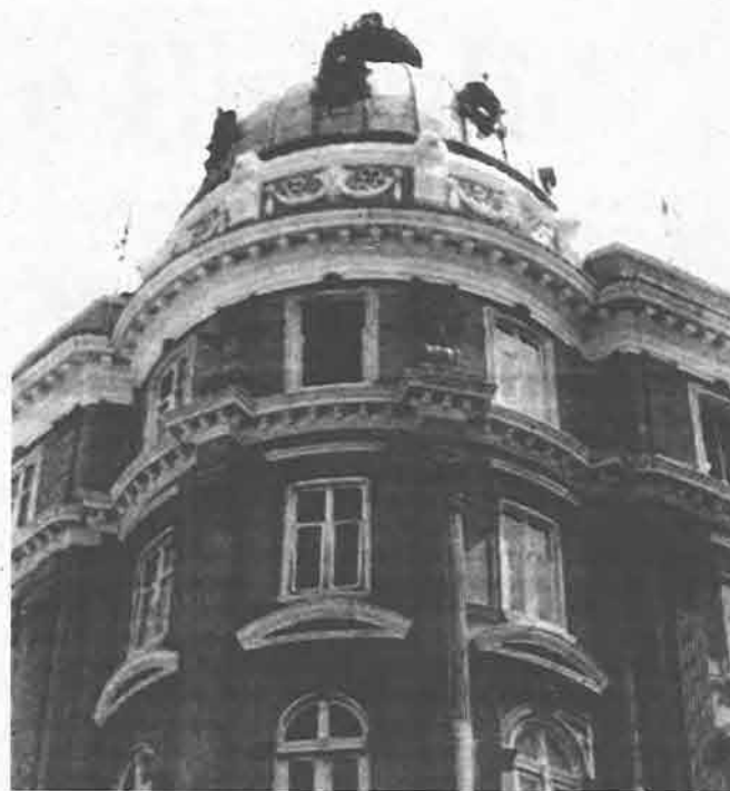
Fiume, palazzo Ploech

Fiume è città, ha rilevato in occasione dell'inaugurazione della mostra, la conservatrice Daina Glavovic che ha guidato il progetto, che può vantare di aver conservato nei fondi dei propri