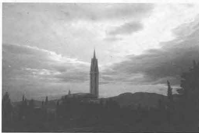
Tramonto sul Quarnero (visto dalle sorelle Iedrisco, attualmente residenti a Trieste).