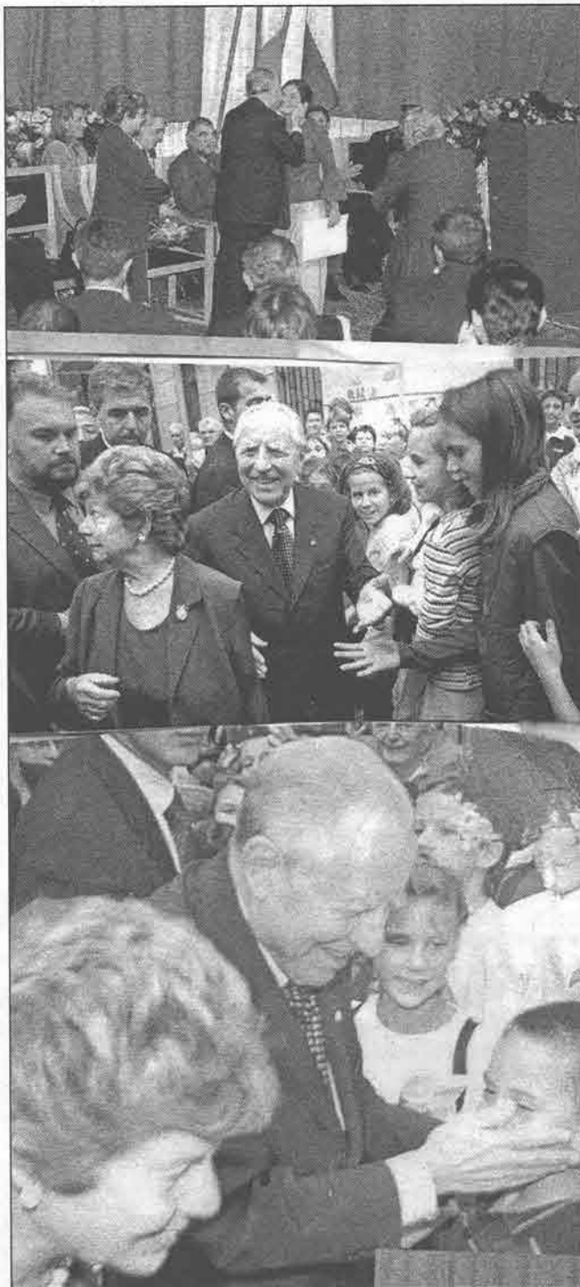
(Foto tratte dal n. 11/2001 del foglio d'informazione "Unione Italiana")

La cultura italiana è un faro per l'Occidente. È sinonimo di libertà, di pensiero anticipatore, di vivacità intel-