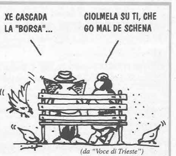
(da "Voce di Trieste")