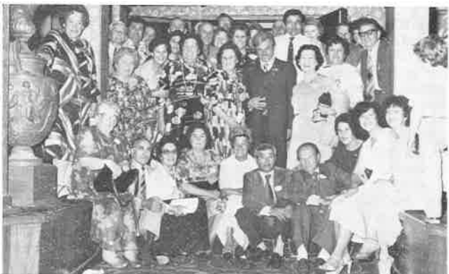
I Fiumani d'Australia si stringono intorno al Sindaco.

Cogliamo l'occasione per rinnovare ai concittadini residenti in quel lontano continente il nostro fraterno affettuoso saluto.