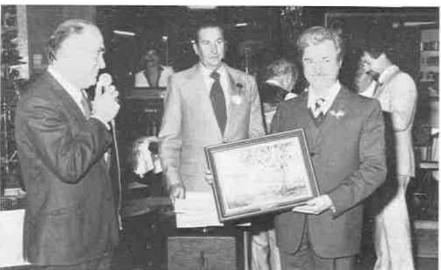
L'offerta all'ospite di un quadro di soggetto australiano.

Ricordiamo ai concittadini tutti che l'annuale