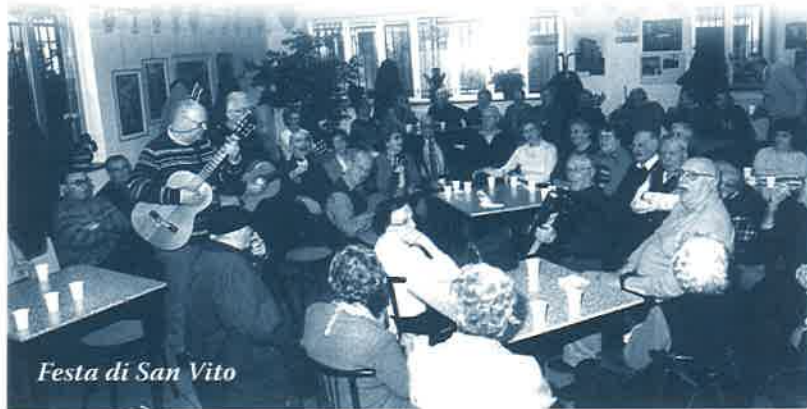
Festa di San Vito

Ero già disperada che a Torino non se gavesi festegià San Vito ma con una gran sorpresa e contentezza go sapù che i lo ga fato al circolo dei giuliani e dalmati el nostro bel ritrovo, una grande caseta a due piani, el pian de sopra ga una sala con bufet e diversi tavolini per i acanidi giogadori de carte. Soto un grande salon con biblioteca, foto sui muri de tute le nostre tere, spazio per convegni culturali, comitive che vien dal' Istria e da altre parti e come d'usanza se fa el rebeghin e le nostre bele cantade, poi se fa mostre dei nostri pitori e tante al-